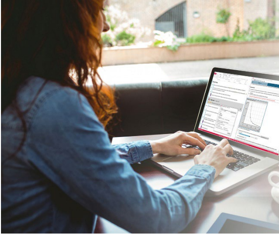
Bild 1: Die LD DIDACTIC beliefert Schulen, Berufsschulen und Universitäten mit Lehrsystemen und Bildungstechnologie.